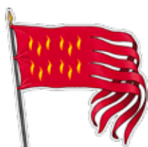
L' Oriflamme «Montjoie St Denis »